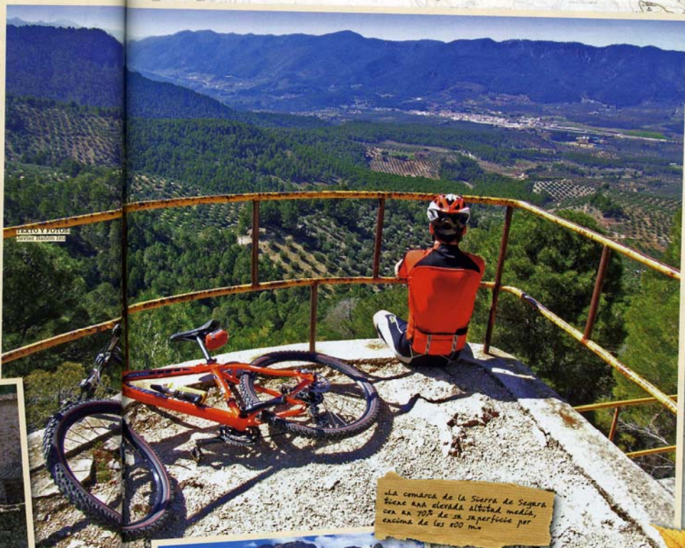
EL SUELO Y LOS CIENOS

La gran riqueza en la flora del espacio queda de manifiesto ante la presencia de más de 1.900 especies de flora vascular, lo que hace de este Parque Natural una de las áreas de mayor interés botánico de Andalucía. Además son propios de estos parajes de montaña los bosques de pinos laricios o salgarreños, con sotobosque de helechos que se muestran en las frescas y húmedas sombras y más adelante aparece en todo su esplendor el bosque mediterráneo que, junto con las zonas de pastos, sirven de alimento al ganado que abunda por esta zona.